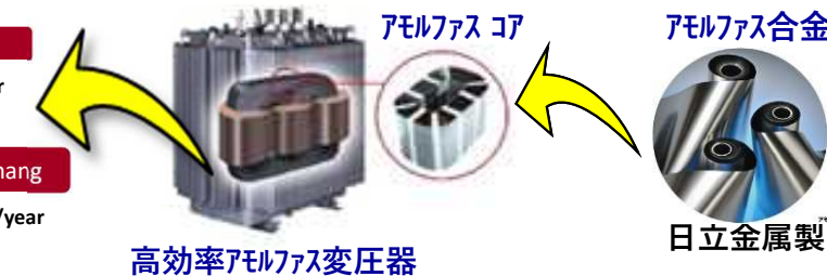
高効率アモルファス変圧器