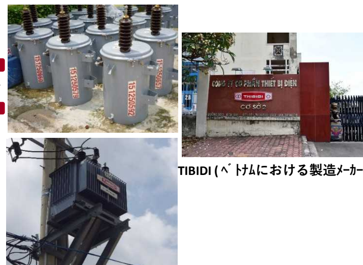
TIBIDI (ベトナムにおける製造メーカー)